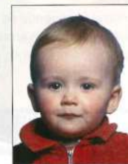
Foto bambino corretta