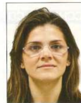
Foto con occhiali corretta