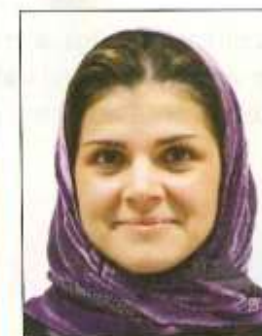
Foto con velo corretta