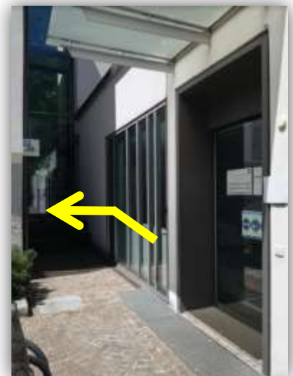
I Servizi Demografici del Comune di Campo Tures